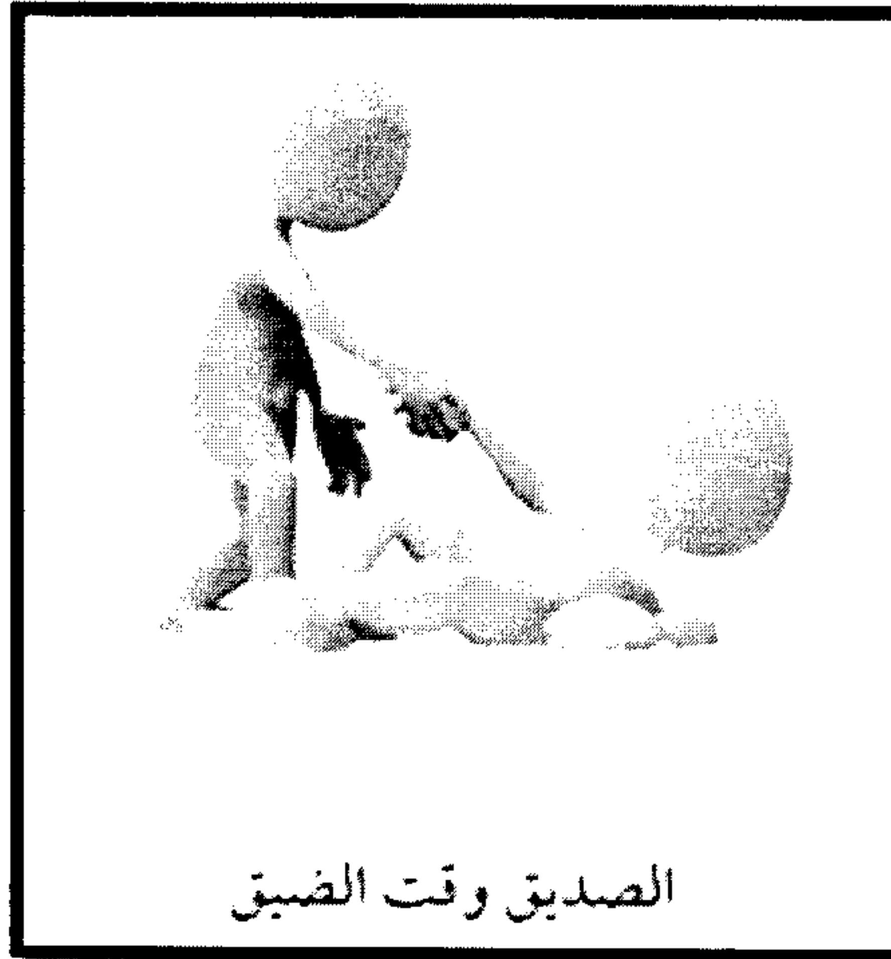
الصديق وقت الضيق